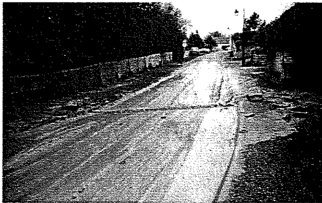
Coulées de boue – Commune de Montgobert